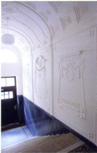
Blicke ins vornehme Vestibül