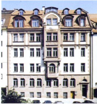
Die sanierte Fassade. Die neuen Gauben fügen sich gut in den Bestand ein