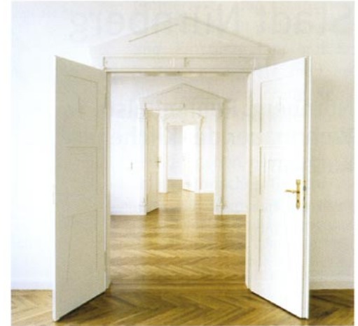
Enfilade nach der Sanierung

Das viergeschossige Wohnhaus mit Mansarddach zeigt an der Straßenfassade klassizierenden Jugendstildekor in Sandstein. Im Rahmen einer Komplettsanierung erhielten die Wohnungen eine zeitgemäße Haustechnik und neue Bäder. Spätere Einbauten wurden rückgebaut, die reichverzierten Türanlagen mit Supraporten restauriert und fehlende ergänzt. Der stuckierte Eingangsbereich wurde ebenso renoviert wie die Treppenanlage mit den gedrehten Balustern. Das Dachgeschoss wurde ausgebaut. Dabei wurden notwendige neue Gauben dem historischen Bestand angepasst. Die Sandsteinzonen der Fassade samt Jugendstildekor wurden fachgerecht renoviert, die Putzfelder ausgebessert und neu gefasst. In vorbildlicher Weise wurden die bestehenden Kastenfensteranlagen schreinermäßig repariert, die Scheiben neu verkittet und abschließend gestrichen. Zur energie-