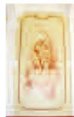
Wandmalerei im Vestibül