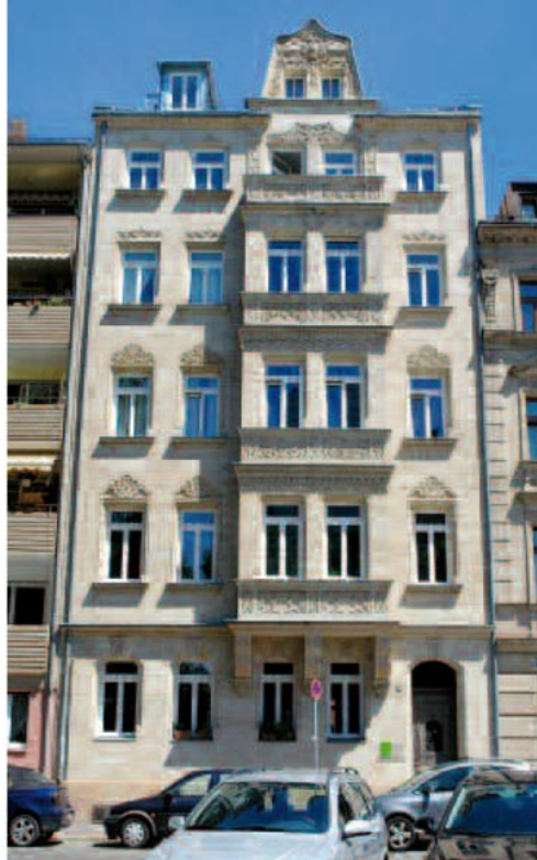
Die prächtige Fassade in saniertem Zustand ...

Das Haus hat einen flachen Erker und einen Zwerchgiebel. Seine Fassade und insbesondere der Erker sind überreich dekoriert mit der für Fürth typischen Mischung aus Neorenaissance-