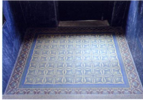
Fußboden im Vestibül