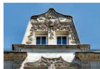
Reich verzierter Erkergiebel