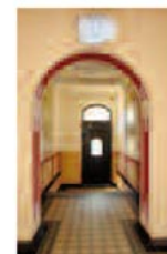
Blick ins Vestibül