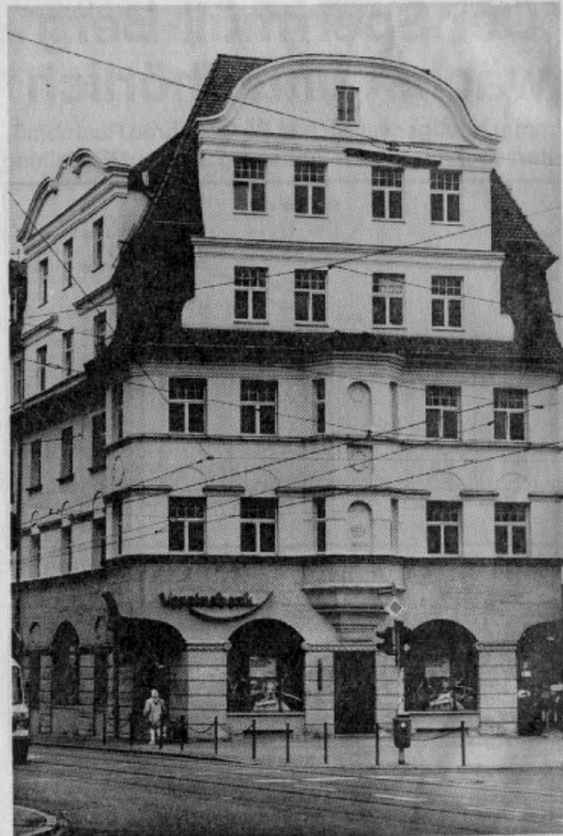
Am Friedrich-Ebert-Platz ist diese schucke Fassade zu bewundern. Das Haus aus dem Jahr 1915 wertet nun die gesamte Umgebung auf.

Beispielhaft für ein ganzes Viertel erschien der Jury, die sich aus Architekten, Kommunalpolitikern und Medienvertretern zusammensetzte, das Anwesen in der Egloffsteiner Straße. Das Siedlungshäuschen wurde mit dem Originalfarbton „Ocker“ auf Vordermann gebracht. Überhaupt spielte diesmal bei der Auswahl auch der Gedanke, mit dem Preis zum Nachahmen zu animieren, eine wesentliche Rolle. Das Gebäude in der Rückertstraße 1 aus dem Jahr 1915, das aus-