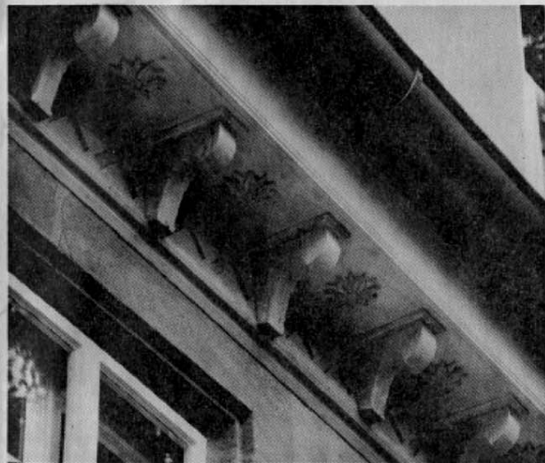
Detail aus dem Anwesen in der Großweidenmühlstraße. Für die aufwendige Renovierung der Fassade erhielt der Besitzer einen Preis.