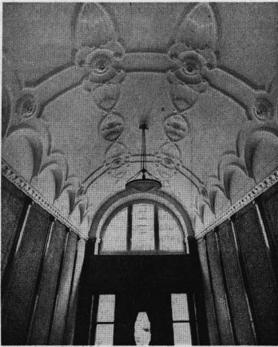
Schönster Jugendstil: Eingang des Hauses Emiliens- straße Nr. 3.

Die Denkmalprämierung soll das Engagement der Besitzer belohnen Neben dem Jugendstilsaal im Hauptbahnhof wurden auch Wohnhäuser prämiert