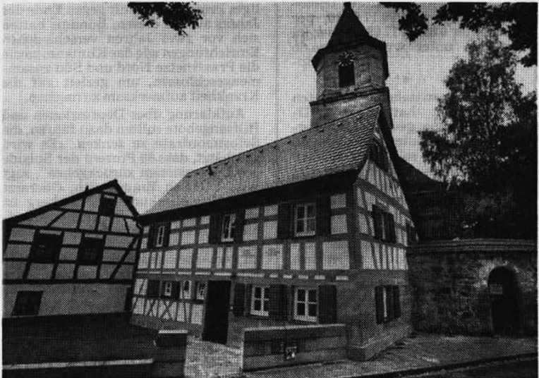
Ein Haus mit Charme: In der Venatoriusstraße Nr. 4 war früher das Korn- burger Ortsgefängnis untergebracht.

Über die einzelnen Objekte und ihre Baugeschichte ist auch ein Begleitbuch zur Denkmalprämie- rung erschienen. Der schön aufge- machte Band mit vielen Bildern kos- tet 10 Euro plus Versandkosten und kann beim Bezirk Mittelfranken Heimspflege, Postfach 617, 91511 Ansbach, bestellt werden. Es gibt auch noch die Begleitbände zu den Denkmalprämierungen von den letzten 12 Jahren.